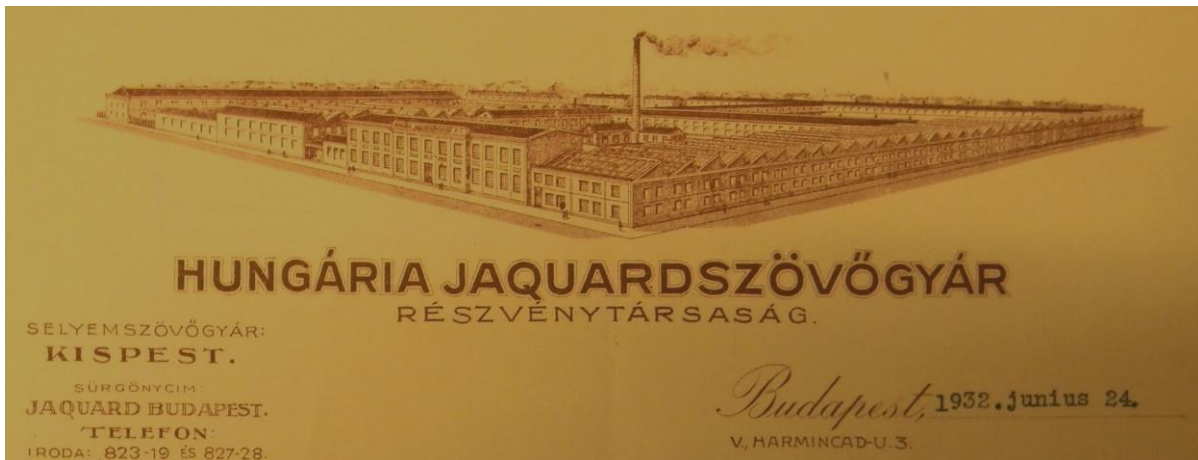
Hungária Jacquard Szövőgyár látképe

BFL VII.2.e Hungária Jacquard Szövőgyár Rt. Cg. 1474, Okm. 2177