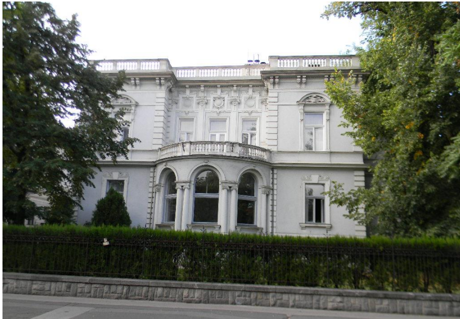
Weiss-palota (VI. Andrásy út 116.)