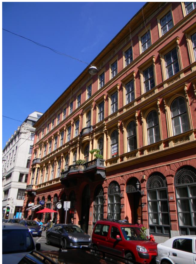
Kohner Zsigmond lakása a Schossberger-palota 2. emeletén helyezkedett el.